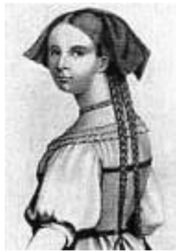
Friederike Brion (1752 - 1813) (vermutliches Aussehen)

Doch dann wäre sie nicht wegen der abgebrochenen Liaison mit Goethe, der seine Liebe zu ihr in zahlreichen "Sessenheimer Liedern" zum Ausdruck brachte, weltberühmt geworden. Ihre Lebensstationen in Sessenheim und Rothau im Elsass und in Diersburg und Meißenheim in Baden wären wohl ohne Belang.